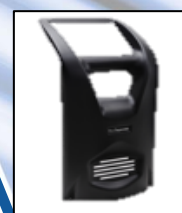
Front Plastic cover